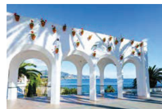
NERJA ET TORROX