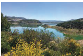
ROUTE DE L'ANIS, UNE JOURNÉE À LA CAMPAGNE