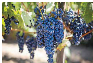
LA ROUTE DES VINS ET DE LA CÉRAMIQUE