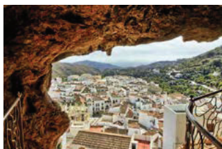
L'OR ANDALOUS (demi-journée)