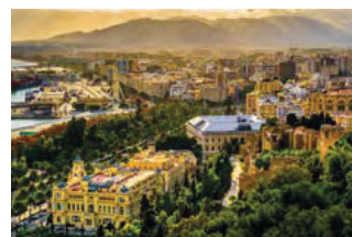
MIJAS & MALAGA