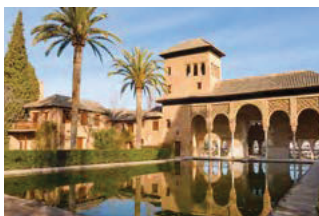
GRANADE ET L'ALHAMBRA (multilingues)